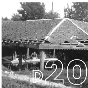
L'HISTOIRE DE VOTRE VILLE Autrefois : les lavoirs à Saint-André