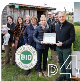
VU À SAINT-ANDRÉ Retour en mots et en photos de votre trimestre