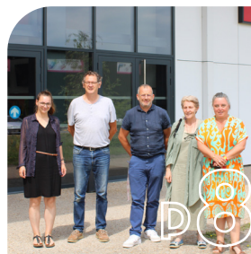
TOUT COMPRENDRE SUR ▸ Les séances «Ciné relax» à la Villa Monciné ▸ L'ouverture du service intercommunal d'action sociale