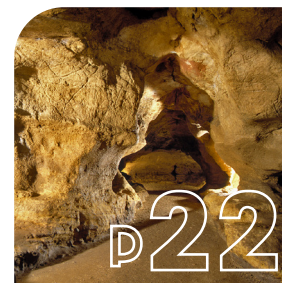
PRÈS DE CHEZ VOUS La grotte de Pair-Non-Pair