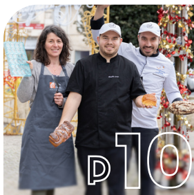
PORTRAIT Rencontre avec vos nouveaux commerçants