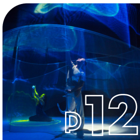
EN SCÈNE ! En 2024, de la culture pour tous les goûts