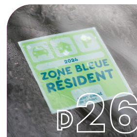
C'EST PRATIQUE Horaires, informations pratiques