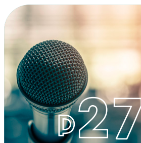
EXPRESSIONS LIBRES Tribunes politiques

DIRECTRICE DE LA PUBLICATION Célia Monseigne