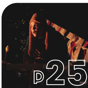
VOS RENDEZ-VOUS Les événements culturels et associatifs de votre trimestre