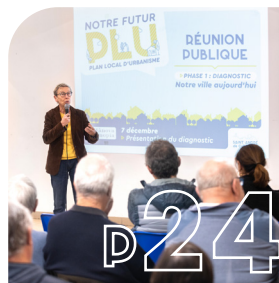
ENTRE NOUS ▸ Notre futur PLU : la révision est lancée ▸ Le retour de vos quartiers !