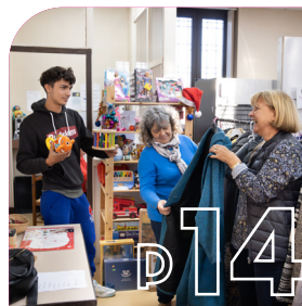
DOSSIER La solidarité à Saint-André des ressources essentielles et nécessaires